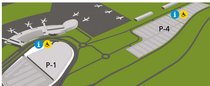
Accesos y aparcamiento

*PMR: Persona con movilidad reducida o discapacidad.