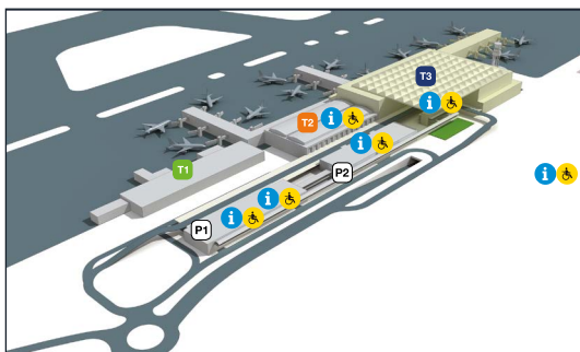
Accesos y aparcamiento

*PMR: Persona con movilidad reducida o discapacidad.