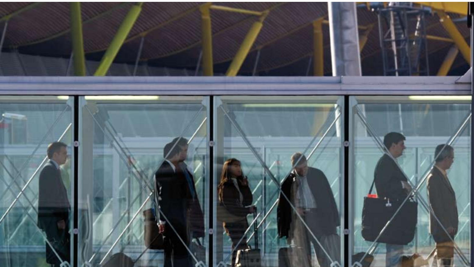
Los aeropuertos facilitan el comercio y la inversión empresarial. / The airports facilitate trade and business investment.