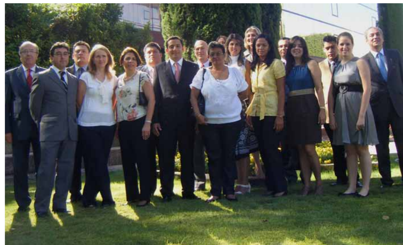
Becarios de Cooperación Internacional