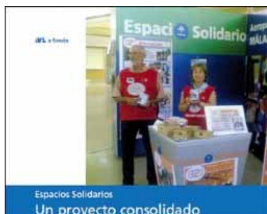
Portada del artículo especial sobre los Espacios Solidarios en los aeropuertos (abril 2010)

Durante 2010 desde el Área de Beneficios Corporativos y Proyectos Sociales, se realizaron una gran cantidad de actividades, prueba de ello fue la continua aparición de artículos sobre actividades en nuestra revista interna "Aena Noticias".