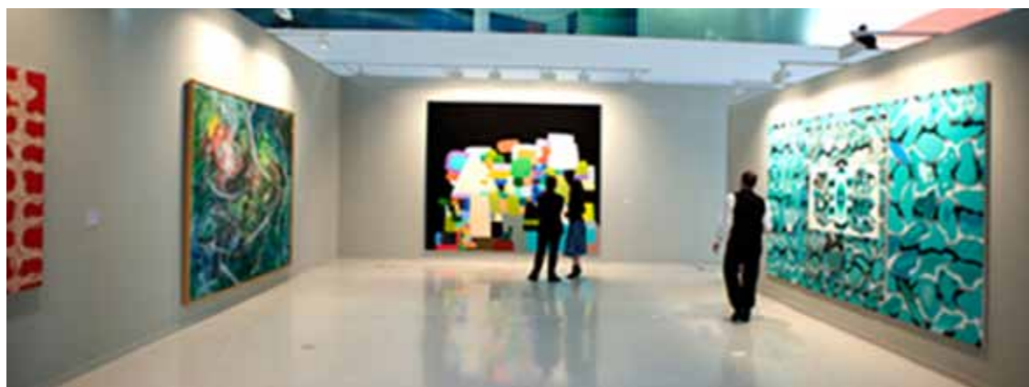
Aena y su Fundación realizan numerosas iniciativas culturales