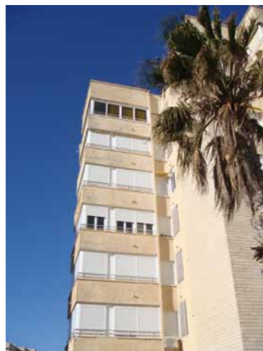
Actuaciones en la urbanización "Urbanova", en el entorno del Aeropuerto de Alicante

Durante el año 2010 Aena prosiguió ejecutando actuaciones de aislamiento acústico, en el entorno de los aeropuertos de A Coruña, Alicante, Barcelona-El Prat, Bilbao, Las Palmas de Gran Canaria, Ibiza, La Palma, Madrid-Barajas, Málaga-Costa del Sol, Menorca, Palma, Pamplona, Sabadell, Santiago de Compostela, Tenerife Norte, Valencia y Vigo, lo que ha supuesto para Aena que, desde el año 2000 hasta finales de 2010, haya realizado una inversión próxima a los 233 millones de euros.