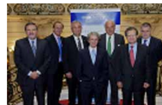
Foto: Acto de la adhesión de Aena al Club de Excelencia en Sostenibilidad (09/06/2010)