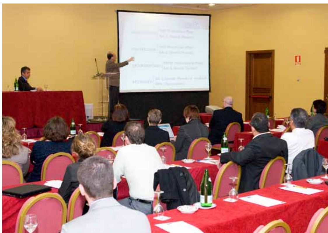
Aena participa en foros internacionales como IATA

Algunas de estas actuaciones son las que reflejan los distintos convenios, acuerdos y proyectos de innovación firmados para el desarrollo de actuaciones en el campo de la navegación aérea o de la gestión aeroportuaria orientada hacia el nuevo modelo europeo de gestión del transporte aéreo previsto en el Libro blanco de la UE y en los diferentes reglamentos que desarrollan el concepto de Cielo Único Europeo.