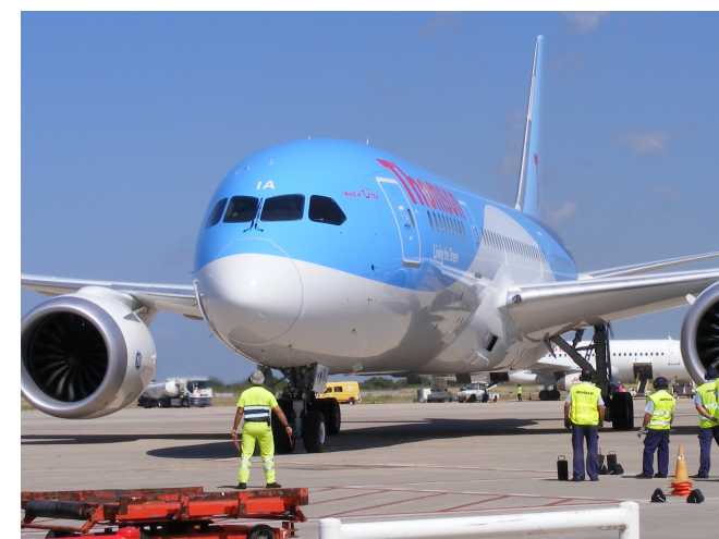
Thomson eligió Menorca como aeropuerto anfitrión del primer vuelo comercial del Dreamliner.