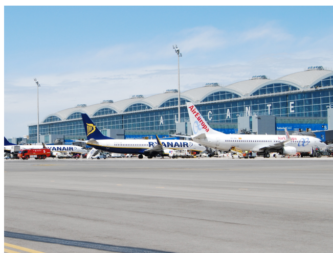
Tendencia de crecimiento de los aeropuertos turísticos de la red en los meses de verano. Alicante-Elche registró en julio la mayor cifra de pasajeros en su historia.