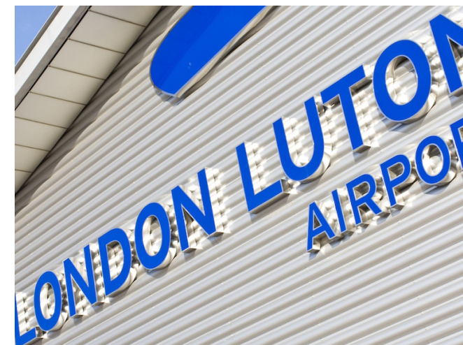
Aena internacional, junto con Ardian, firmó un acuerdo de compra del Aeropuerto de London-Luton.