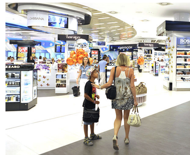
Se inauguró la tienda pasante más grande de Europa, hasta el momento, en el Aeropuerto de Palma de Mallorca.