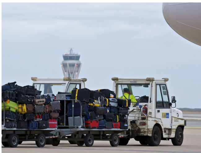
Se inició el proceso de renovación de las licencias handling de los aeropuertos de la red.