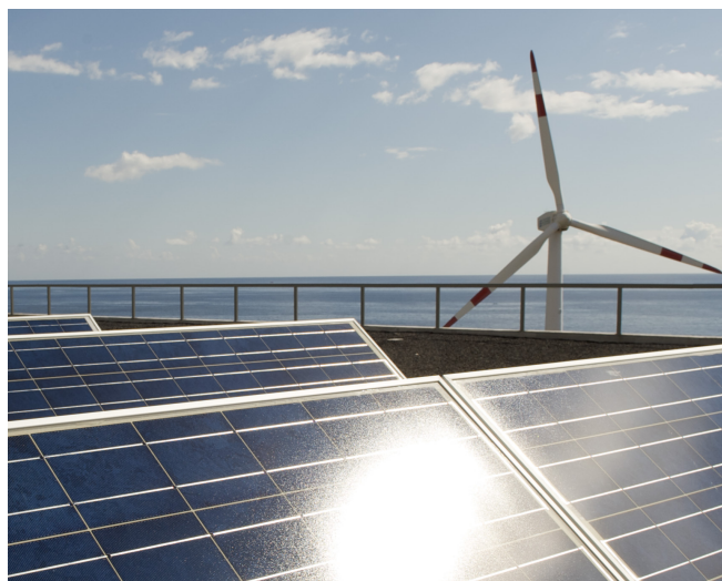
Eficiencia en el consumo y uso de energías renovables en los aeropuertos e instalaciones de Navegación Aérea .