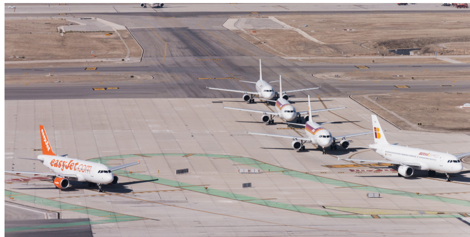
Los aeropuertos de Barcelona-El Prat, Adolfo Suárez Madrid- Barajas y Palma de Mallorca, entre los diez mejores del sur de Europa, según la encuesta anual realizada por Skytrax.