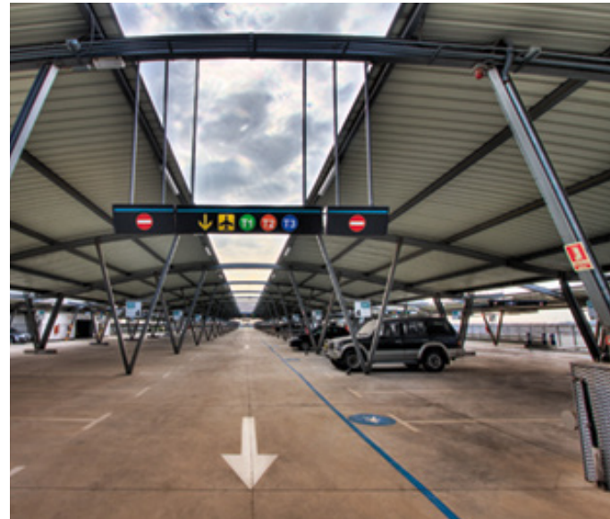
Aena licitó la gestión integral de los aparcamientos de 32 aeropuertos de la red.