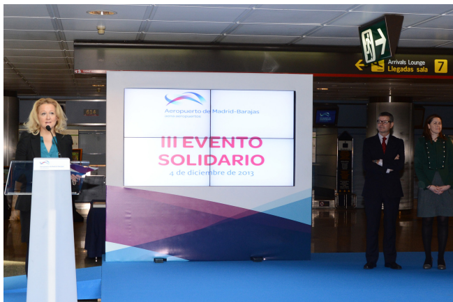
Las campañas solidarias tales como las realizadas en Barcelona-El Prat en ayuda a los niños refugiados de Gaza llamada “La cadena de ayuda humanitaria”, o el Evento Solidario” celebrado en el Aeropuerto Adolfo Suárez Madrid-Barajas.