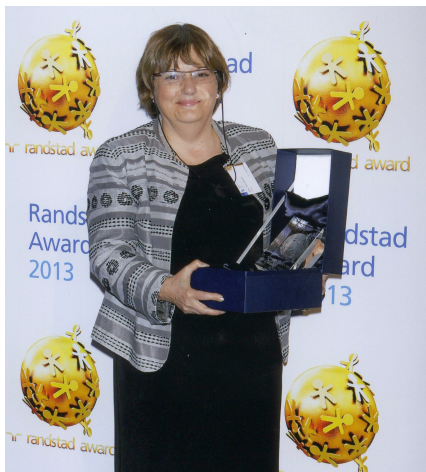
Randstad Award 2013 reconoce a Aena por su atractivo como empresa para trabajar.