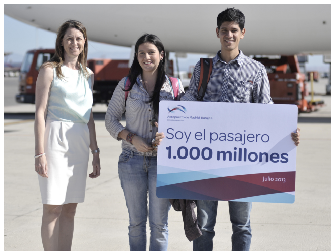
Adolfo Suárez Madrid-Barajas recibió a su pasajero 1.000 millones después de más de 80 años de historia.