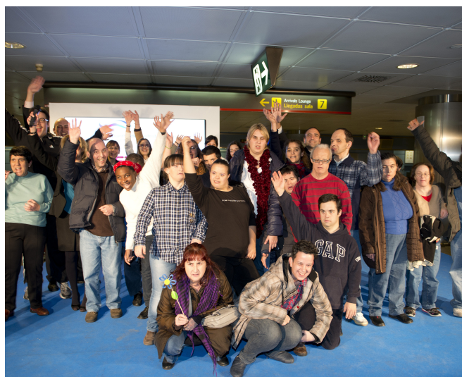
Celebración del III Evento solidario en el Aeropuerto Adolfo Suárez Madrid-Barajas.