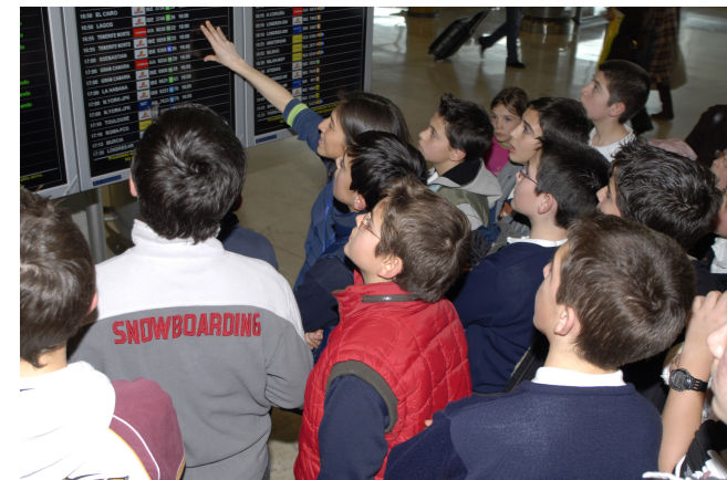
Las visitas a las instalaciones aeroportuarias, tanto de escolares como de otros colectivos, es otra de las actividades organizadas por los aeropuertos de la red.