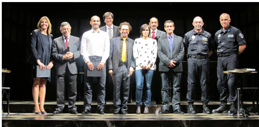
La Asociación Heart Corazón Segunda Oportunidad distinguió a Aena por su esfuerzo en la disposición de desfibriladores en los aeropuertos de la red.