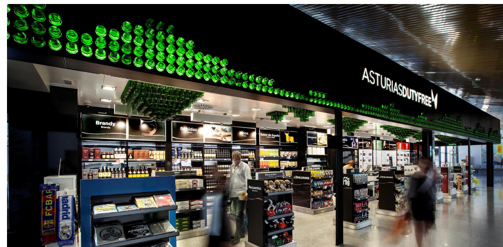
World Duty Free Group inauguró sus tiendas en los aeropuertos de A Coruña, Asturias, Barcelona-El Prat, FGL Granada-Jaén y Santander.