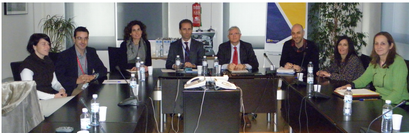
Reuniones de los aeropuertos de la red con grupos de interés (comités facilitadores de la carga, reuniones por temas acústicos, comités de rutas, comités de seguimiento ambiental...) derivadas del impacto que crea la actividad aeroportuaria en el entorno.