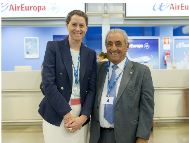
Air Europa y Skyteam escogieron la T1, T2 y T3 de Adolfo Suárez Madrid-Barajas como su segundo hub.