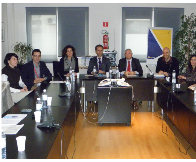
Periódicamente, Aena celebra comisiones de seguimiento ambiental en los aeropuertos.