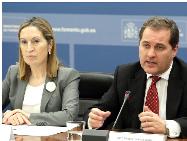
La ministra de Fomento, Ana Pastor, presentó un acuerdo alcanzado por Aena y las compañías aéreas sobre las tarifas aeroportuarias para los próximos 5 años.