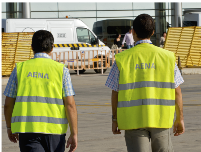
En junio de 2013 finalizó el Plan Social de Desvinculación Voluntaria.