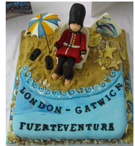
En verano, España y Reino Unido lideraron el ranking europeo de nuevas rutas.