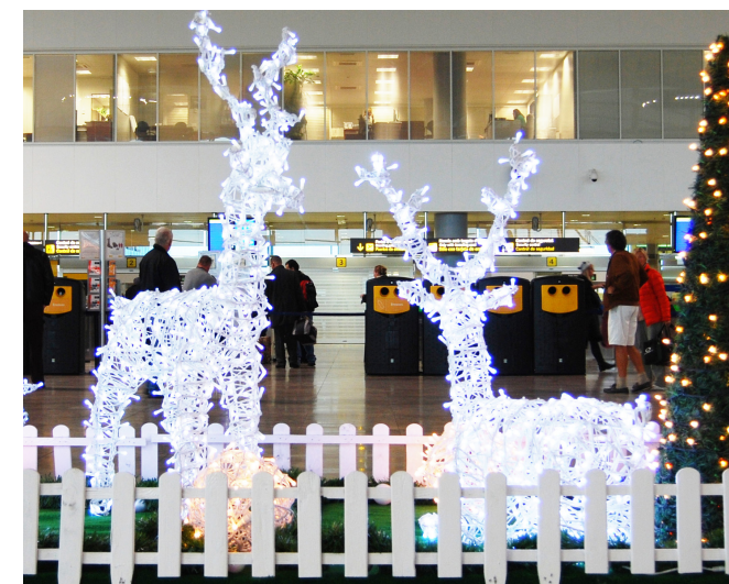
En el mes de diciembre los aeropuertos de la Red de Aena prepararon la Navidad y decoraron sus terminales.