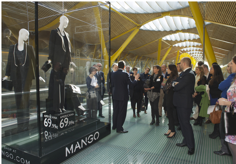
Comenzamos el año con las obras de remodelación de la T4 y la T4S de Barajas para lanzar una nueva línea de negocio basada en el lujo y la moda de alta gama.