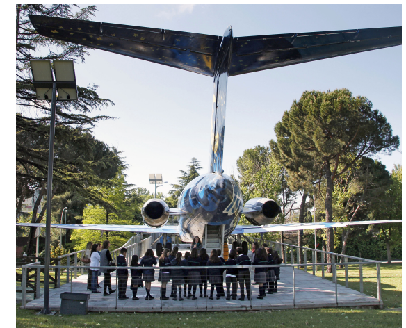
Celebración en los aeropuertos del Día Mundial del Medio Ambiente.