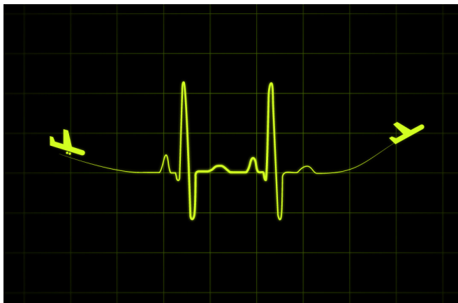
En colaboración con la Organización Nacional de Transplantes (ONT), los aeropuertos de Asturias, Baleares, Canarias, Melilla, Málaga-Costa del Sol, Adolfo Suárez Madrid-Barajas, Barcelona-El Prat, Valencia y los aeropuertos de Castilla y León, realizaron cerca de 13.000 vuelos ambulancia.