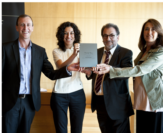
Las salas VIP del Aeropuerto de Barcelona-El Prat y Málaga-Costa del Sol fueron galardonadas por Priority Pass.