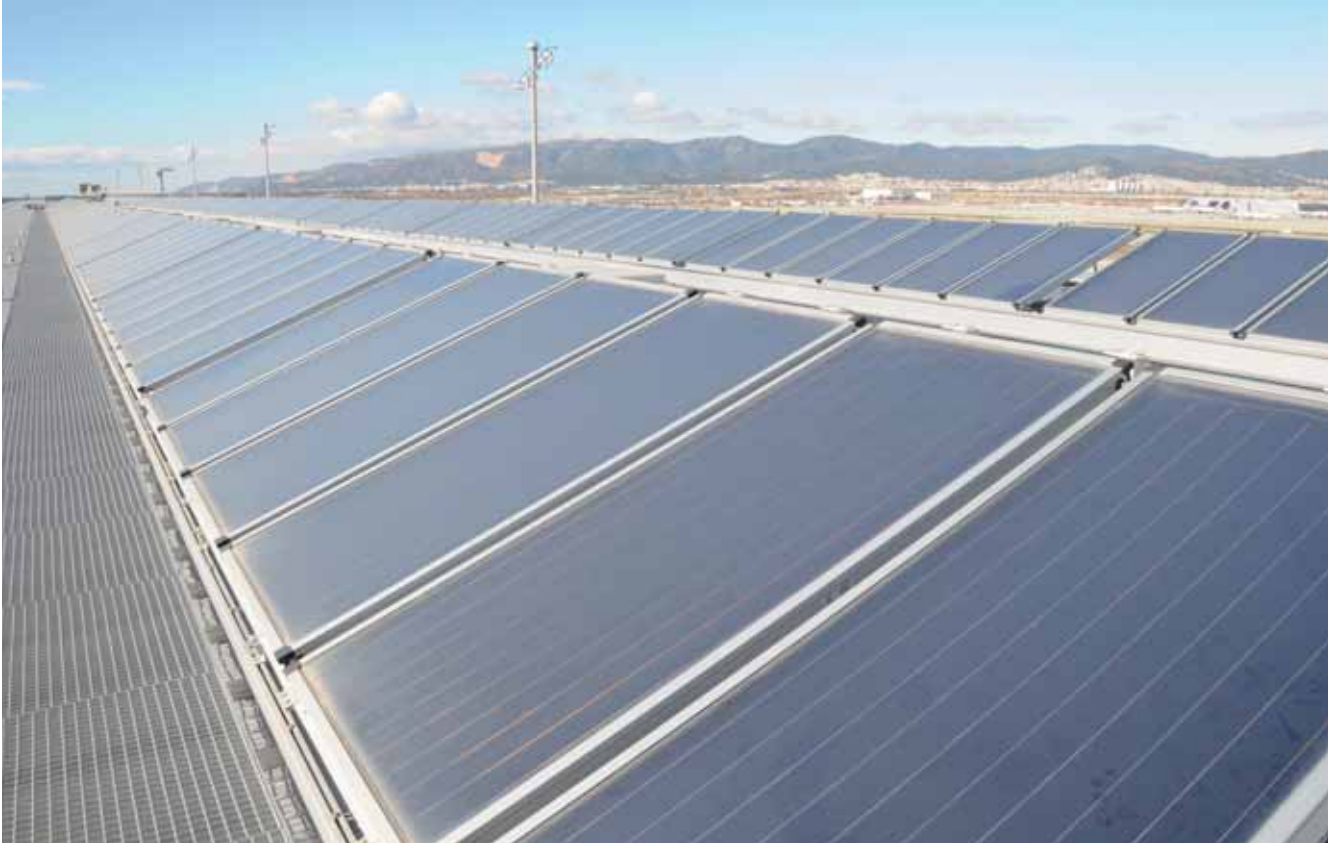
Paneles de energía solar en el Aeropuerto de Barcelona-El Prat.