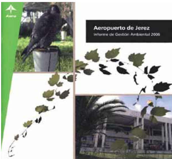
Informe de gestión ambiental del Aeropuerto de Jerez. The Environmental Management Report of Jerez Airport.

Several airports also publish educational material on the environment aimed at school children and adults, such as that corresponding to the «interactive air classroom» created by Palma de Mallorca Airport.