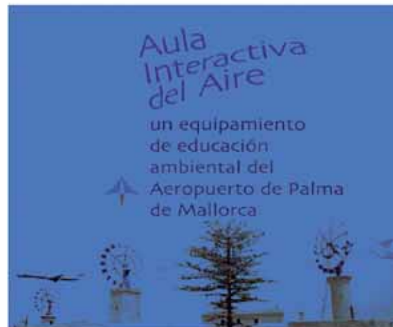
Cuaderno educativo del Aeropuerto de Palma de Mallorca. Educational sheet from Palma de Mallorca Airport.