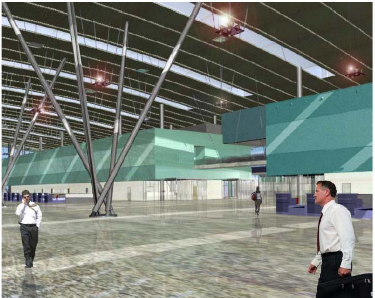
Imagen virtual del interior