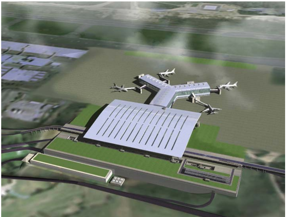
Imagen virtual del Nuevo Edificio Terminal

El acceso al nuevo área terminal se realiza desde la rotonda de entrada al aeropuerto y su trazado se ha hecho de forma que el lazo se adapte en la medida de lo posible al terreno y que permita el acceso a los distintos niveles del edificio y del aparcamiento.