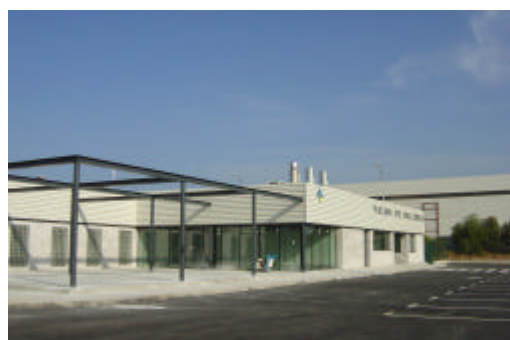
Vista desde el lado aire