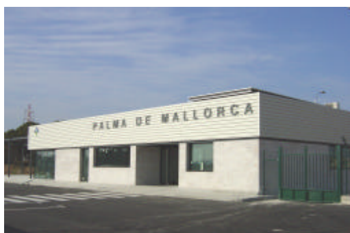
Vista desde el lado aire

Todas las actuaciones contempladas en este expediente se encuadran dentro del marco del Plan de Infraestructuras 2000-2007 del Ministerio de Fomento. La finalidad de estas obras es dotar al Aeropuerto de Palma de Mallorca de unas modernas instalaciones e infraestructuras que permitan atender, dentro de unos adecuados niveles de seguridad y calidad, la demanda del tráfico aéreo.