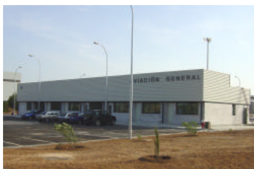
Fachada lado tierra

NUEVA TERMINAL DE AVIACIÓN GENERAL AEROPUERTO DE PALMA DE MALLORCA