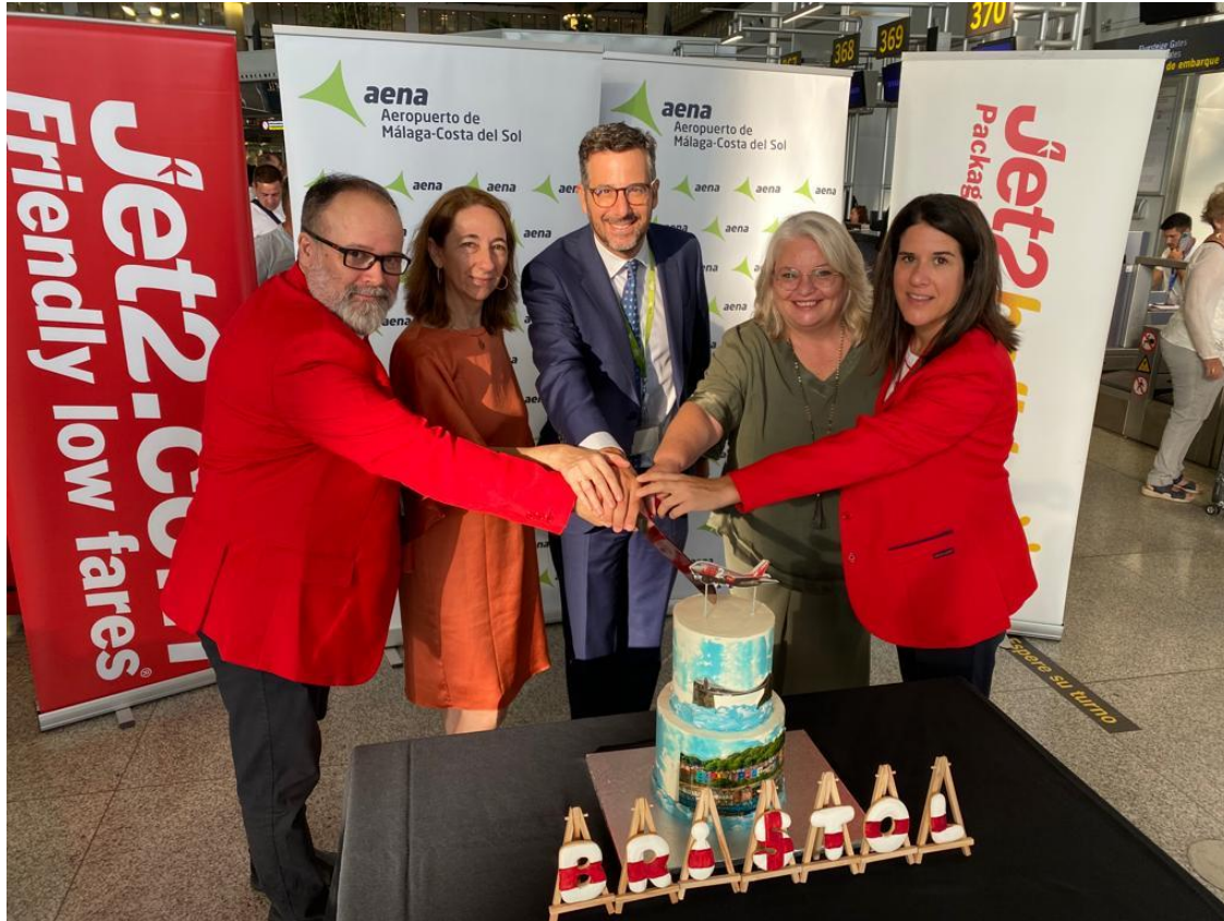
Imagen del corte de la tarta conmemorativa.