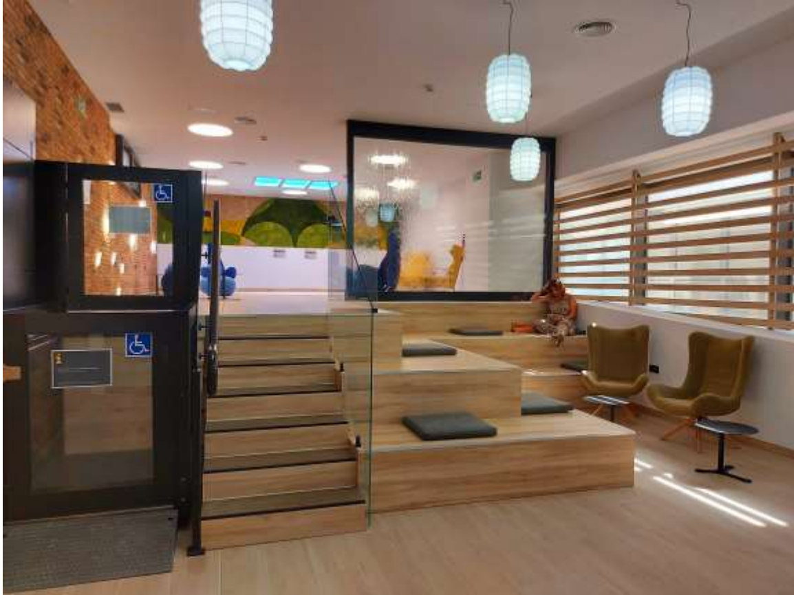
La nueva 'Sala del Silencio', esta mañana.