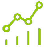
La economía española

Impacto de la Covid-19 en la economía española, el turismo y el transporte aéreo