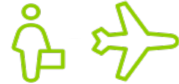
El tráfico aéreo