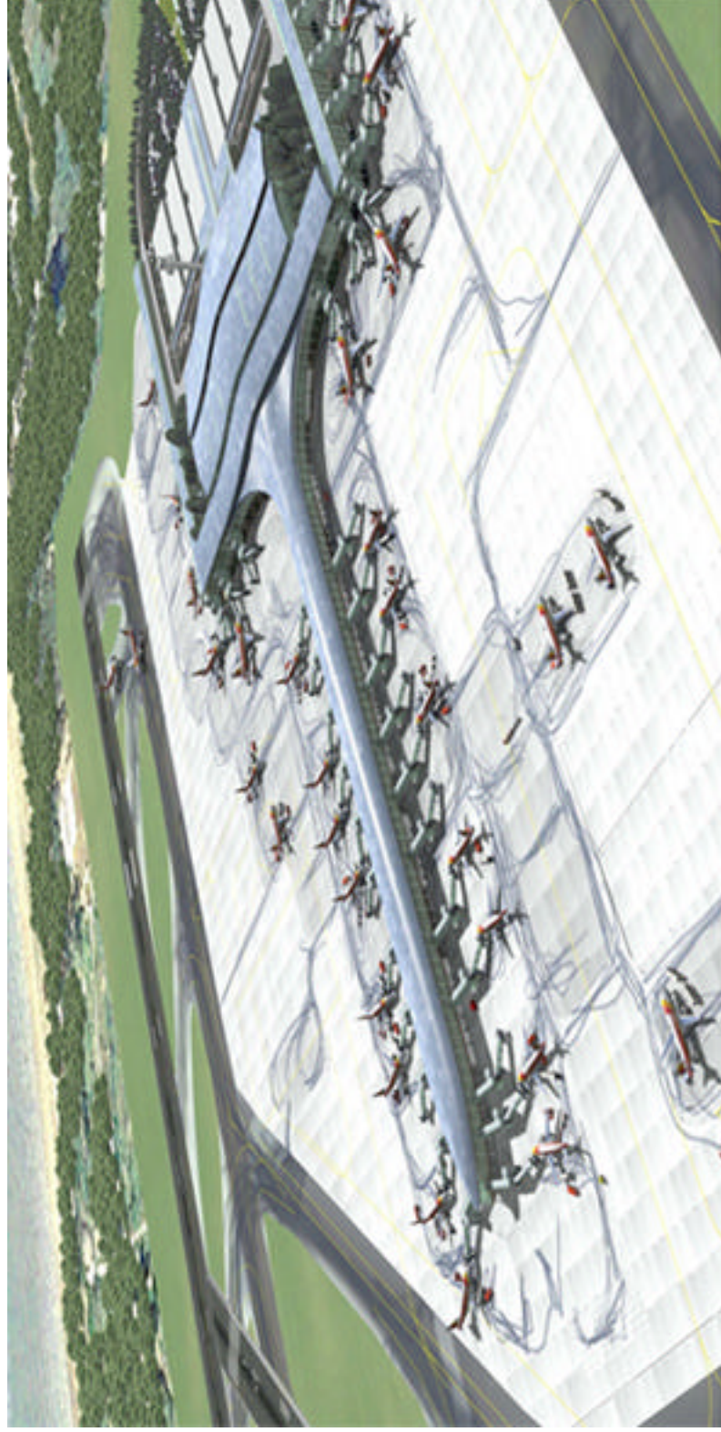
Imàgen virtual de la futura Terminal Sur del Aeroport de Barcelona