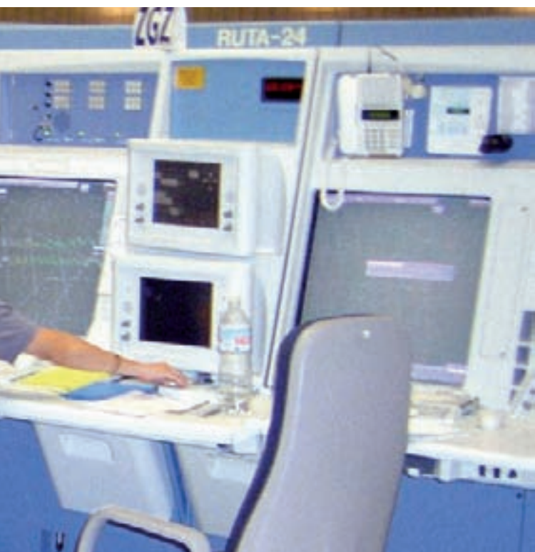
Centro de Control Madrid-Torrejón.