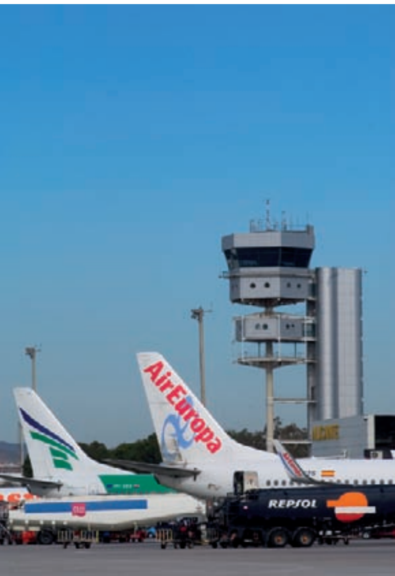
Torre de control del Aeropuerto de Alicante.