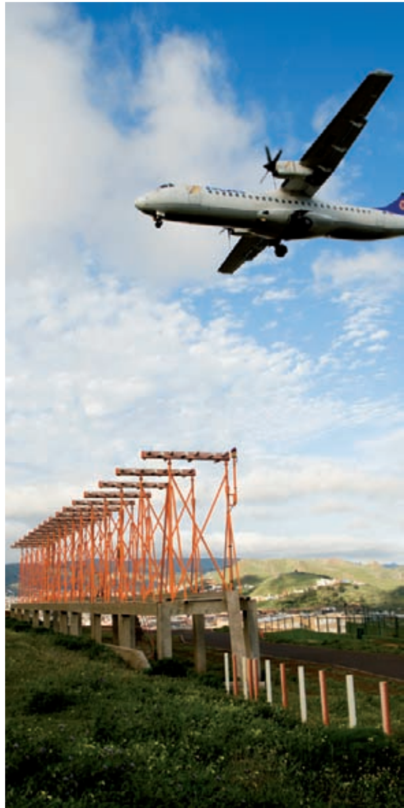
Sistemas de Navegación Aérea en el Aeropuerto de Tenerife Norte.