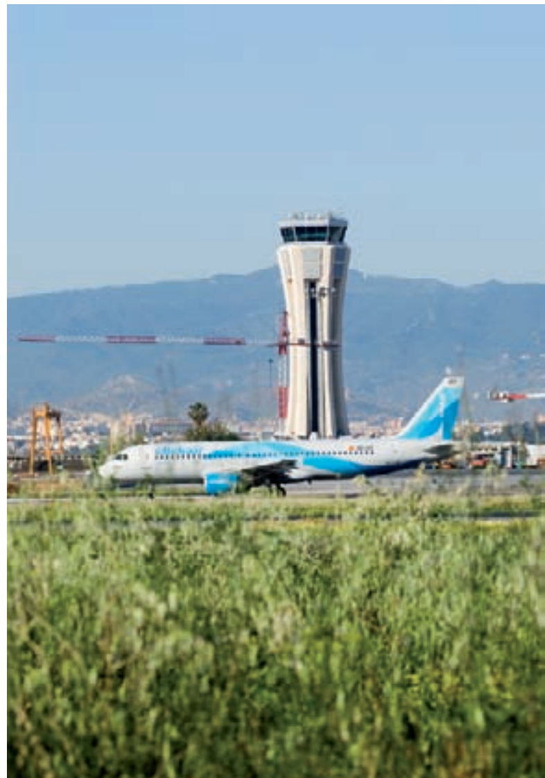
Torre de control del Aeropuerto de Málaga.