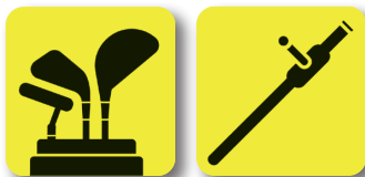
Objetos contundentes Blunt objects