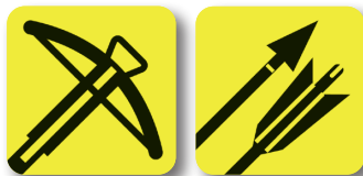
Otro tipo de armas Other weapons