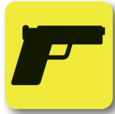
Armas de fuego Firearms