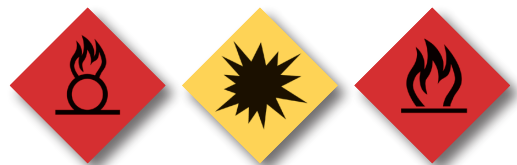
Sustancias explosivas e inflamables Explosive and flammable substances

-Consultar el Reglamento (CE) 272/2009. -ORDEN FOM/808/2006 de 7 de marzo. -Las Autoridades Competentes podrán prohibir otros artículos distintos de los enumerados anteriormente. Dichas autoridades harán un esfuerzo para informar a los pasajeros sobre tales artículos. -El personal de seguridad podrá denegar el acceso a la zona restringida de seguridad y a la cabina de una aeronave a cualquier pasajero en posesión de un artículo no enumerado anteriormente y que suscite su recelo.