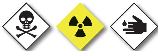
Sustancias químicas y tóxicas Chemical and toxic substances