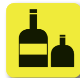
Líquidos. Salvo excepciones Liquids. With exceptions