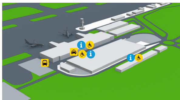
Accesos y aparcamiento