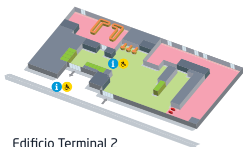
Edificio Terminal 2