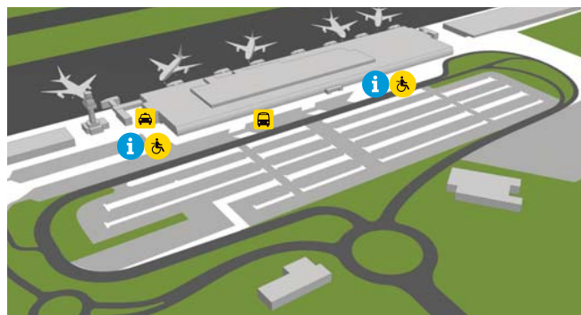
Accesos y aparcamiento