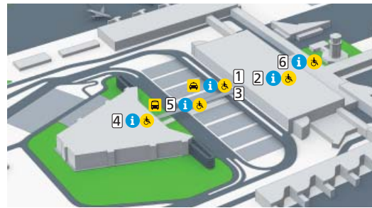
Accesos y aparcamiento