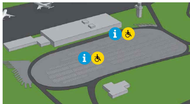
Accesos y aparcamiento